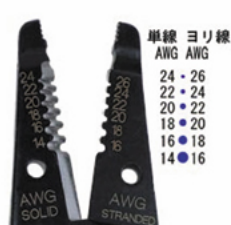
単線/ヨリ線共有ホール 45-121/45-316 45-416/45-616