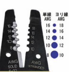
単線/ヨリ線共有ホール 45-315