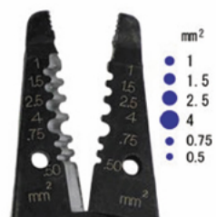
MM仕様 45-125-341/45-310-341 45-317-341/45-425-341