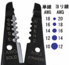
単線/ヨリ線共有ホール 45-120/45-415/45-915