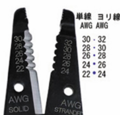
単線/ヨリ線共有ホール 45-125/45-317 45-417/45-617