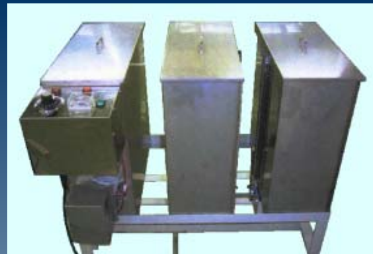
右から洗浄槽、すすぎ槽、乾燥槽