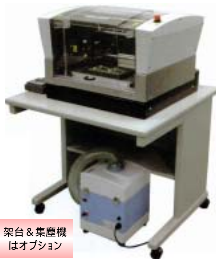
架台 & 集塵機 はオプション