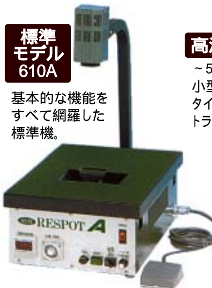
高温作業対応モデル・410H

~550 の高温作業に対応できる小型機種で、ヒーター容量も通常タイプの2倍にパワーアップ。トランス、コイルのハンダ付に最適。