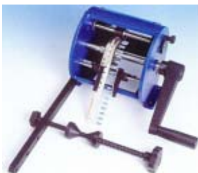
本体とリールホルダー(品番:BR6)