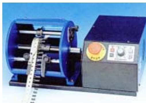
モータードライブ(MOT98)を取り付けた様子