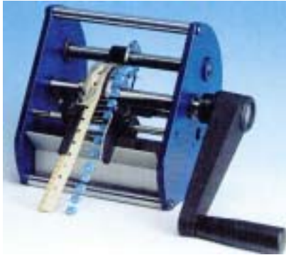
エコノミーモデル・TP6/R-EC