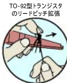
金属棒を併用します